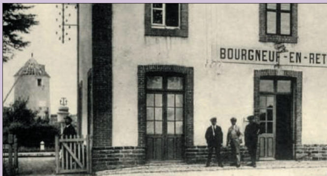
La gare de Bourgneuf-en-Retz au début du XXème siècle.