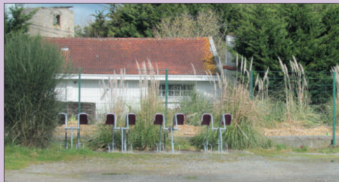
Aujourd'hui un parking a remplacé le bâtiment de la gare.