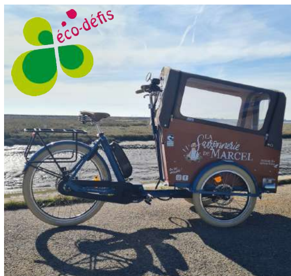
➔ Vélo cargo de la Savonnerie de Marcel surnommé «Carlos» après un vote sur les réseaux sociaux.

Décernée par la Chambre des Métiers et de l'Artisanat, la marque Eco-défis valorise les entreprises s'engageant en faveur de la transition écologique via des actions concrètes. La Savonnerie de Marcel, a par exemple, acheté un vélo cargo pour les livraisons de proximité et le Fournil de la Baie sensibilise sa clientèle à l'apport de contenants pour limiter les emballages. Cette démarche soutenue à hauteur de 50% par la municipalité et Pornic Agglo Pays de Retz a pour vocation d'encourager les initiatives durables menées par nos entreprises. Rendez-vous le 5 juin à Pornic pour la remise de trophées !