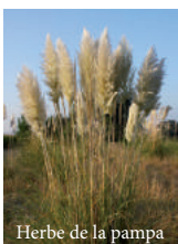
Herbe de la pampa