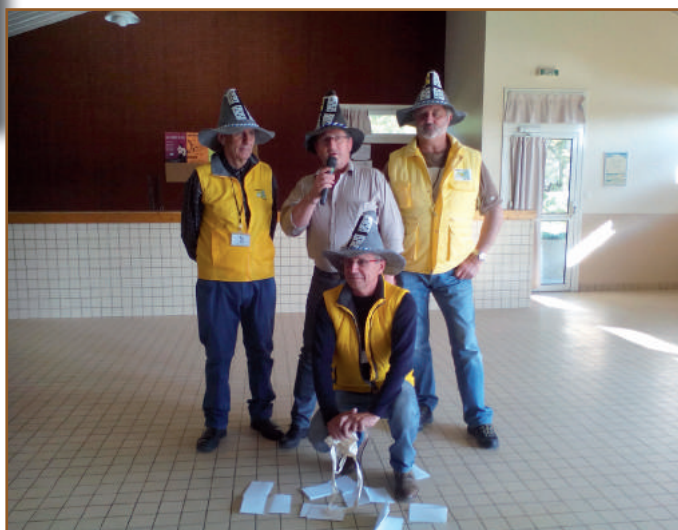
Représentation Théâtrale par l'association «Pour tout l'art de monde» le 27 mai 2016.