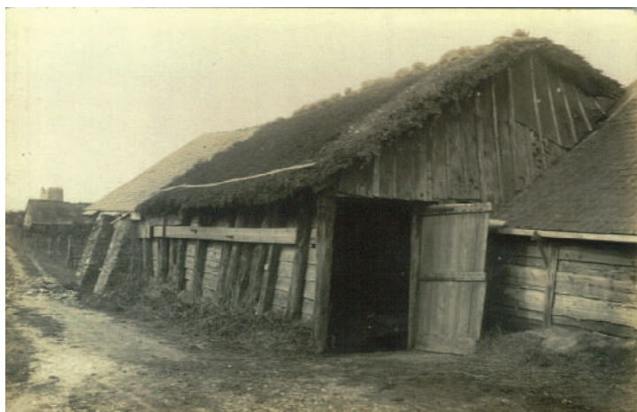
Salorge rue de la Taillée - 1919