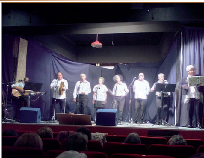
Concert des Camaros de la Poiluse le 14 mai 2016.