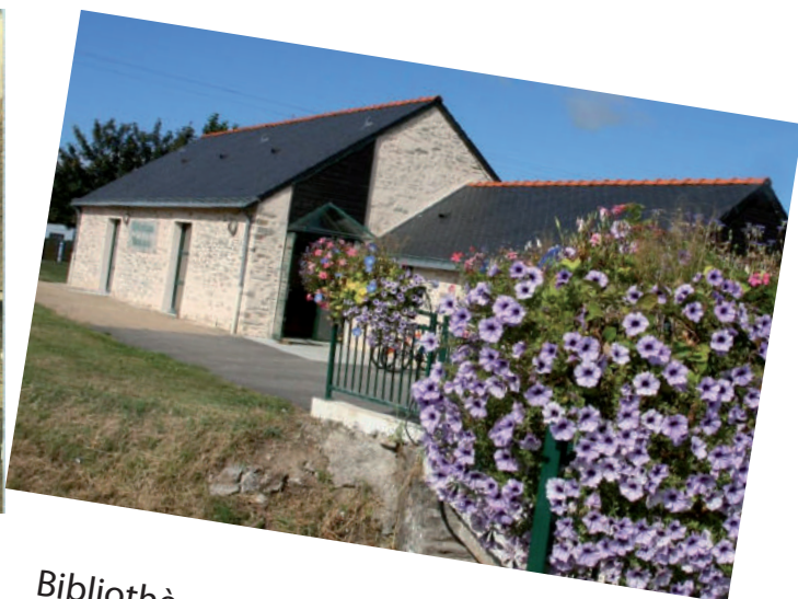
Bibliothèque rue de la Taillée