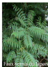
Faux vernis du Japon