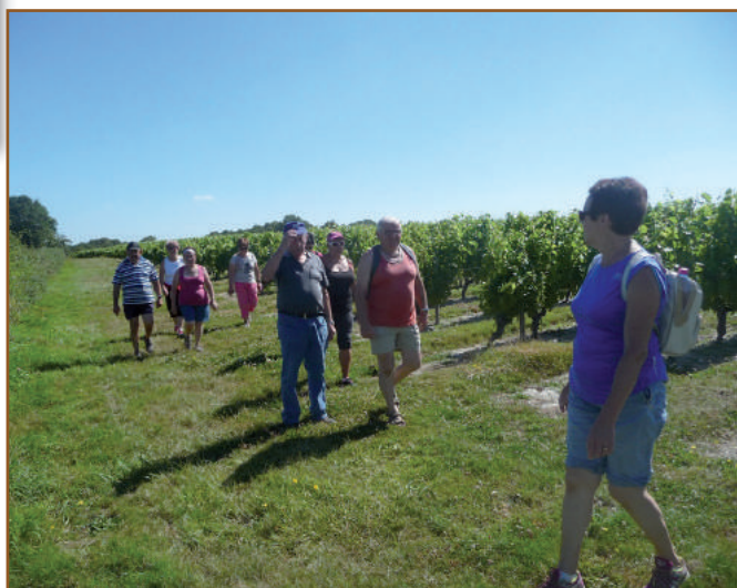
Les aînés du Club amitiés Saint-Cyriennes ont fêté l'été en proposant une randonnée. Une vingtaine de participants ont pris le départ sur 5 ou 7 kilomètres, le 17 juillet 2016.