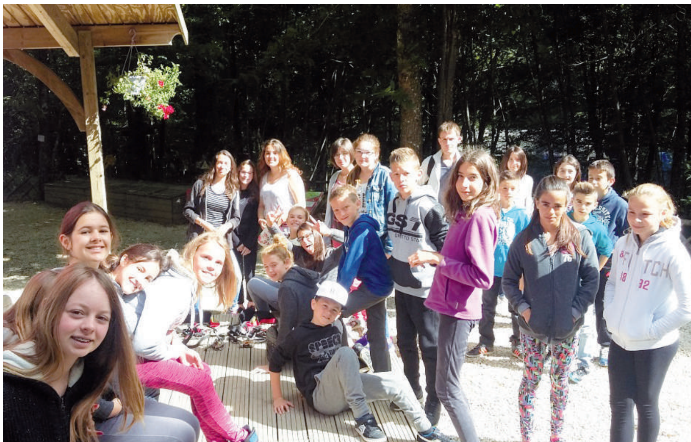
Sortie Parc accrobranche