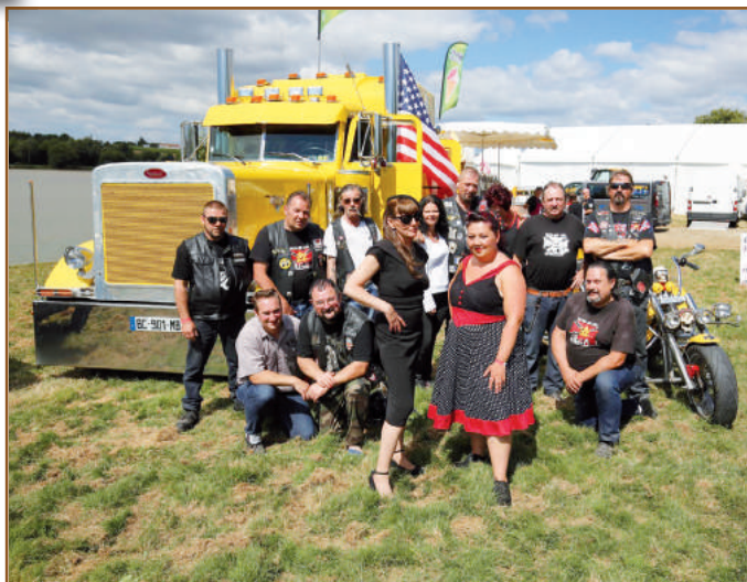
Concentre US organisé par l'association Les Burners aux étangs, route de Nantes, les 06 et 07 août 2016.